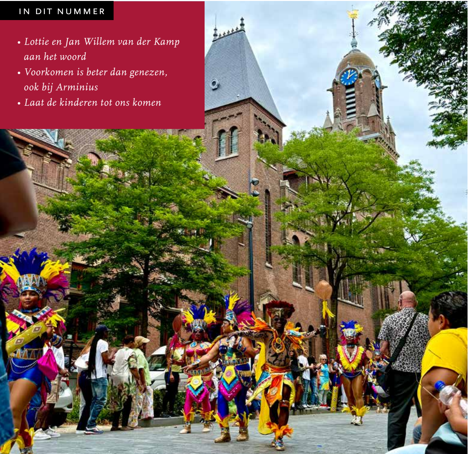
Zomercarnaval Rotterdam