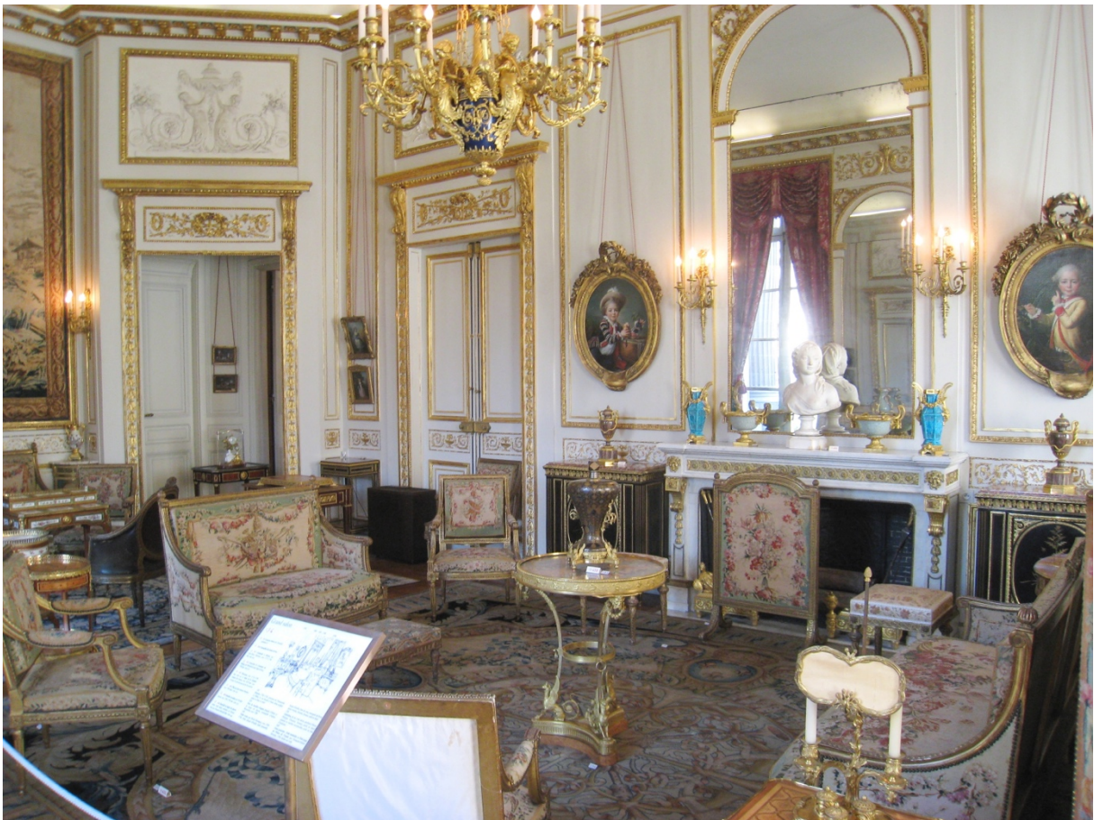
Mussée de Nissim Camondo