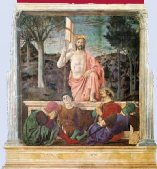
Piero della Francesca (1492), de opstanding