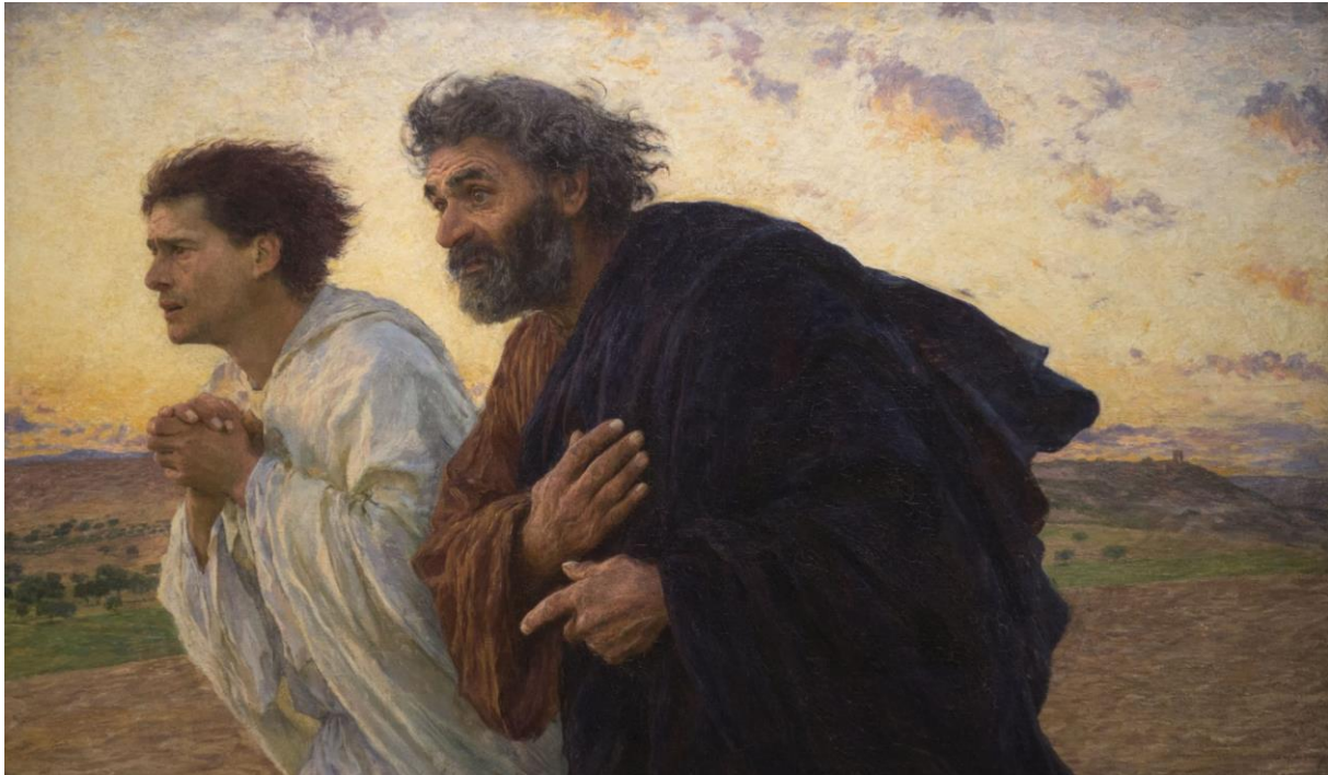
Eugène Burnand, de discipelen Petrus en Johannes haasten zich naar het graf