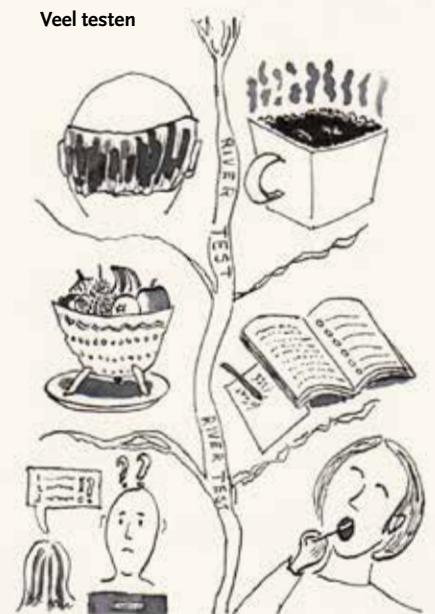
Tekening: Titus van Hille