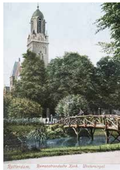
Rotterdam, Remonstrantsche Kerk, Westersingel

De spelling is wat merkwaardig, maar het is wel een mooie foto! Herkent u de brug van andere singels? ■